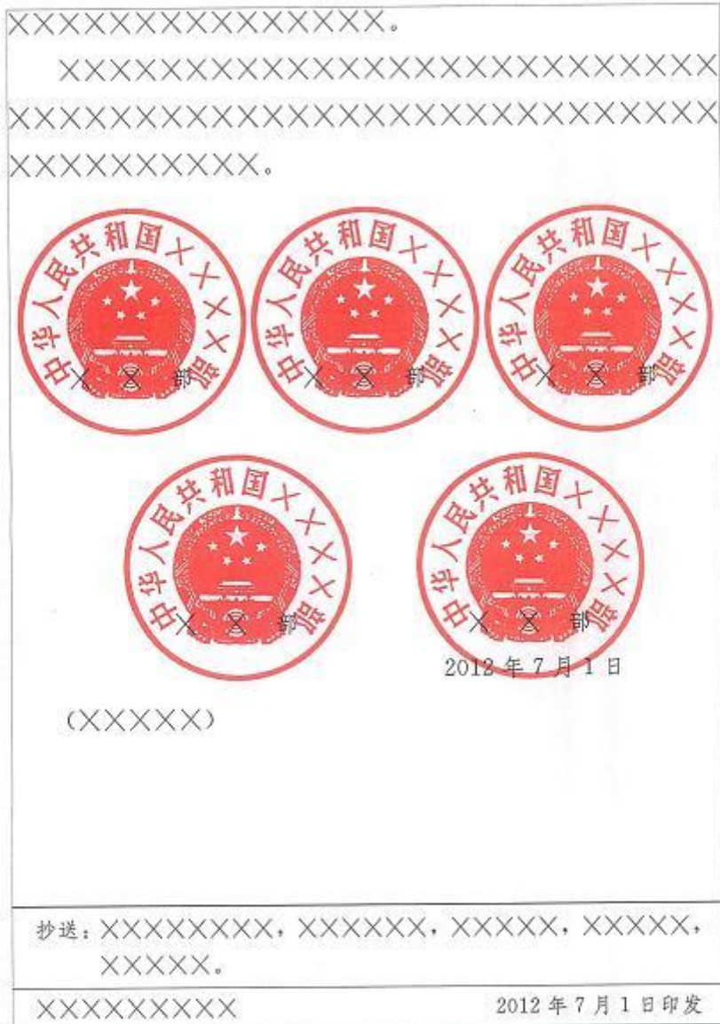
图 8 联合行文公文末页版式 2